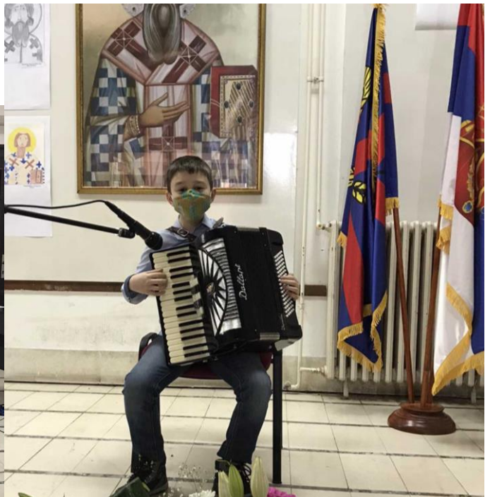
Са снимања Светосавске академије, КЦ Пећинци

- Концерт поводом Дана школе – одржан у холу Културног центра Рума. Наступили су награђени ученици и школски оркестар.