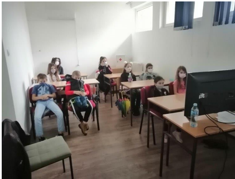
Радионица „Музика и цртани филм“ у Пећинцима