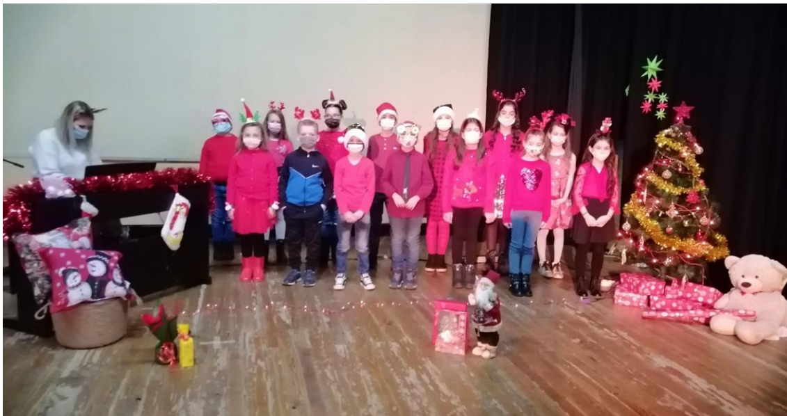
Са снимања овогодишњег концерта у Пећинцима

- Онлајн новогодишњи концерти ученика. Услед мера заштите, концерти отвореног типа нису могли бити реализовани, као ни већа окупљања. Како не би прекинули традицију новогодишњих концерата, наставници музичке школе су одабрали најуспешније ученике из својих класа, снимили их у новогодишњем руху, да би касније сви ти снимци били монтирани у два одвојена видео снимка доступних на Јутјуб каналу школе и на званичном сајту.