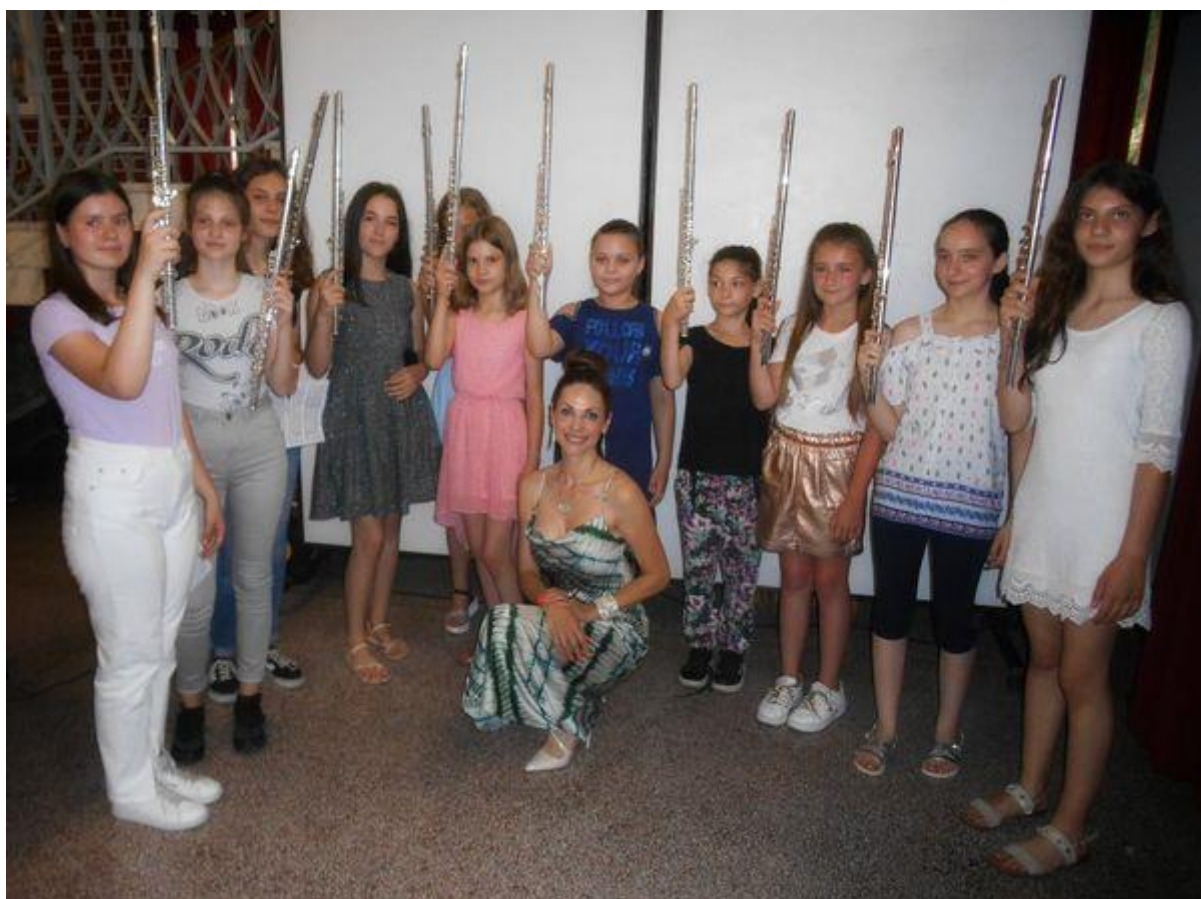
Са концерата у иступеном одељењу у Ст. Пазови