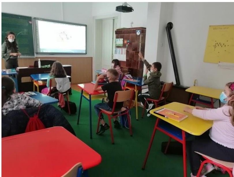
Радионица „Музика и цртани филм“ у Руми