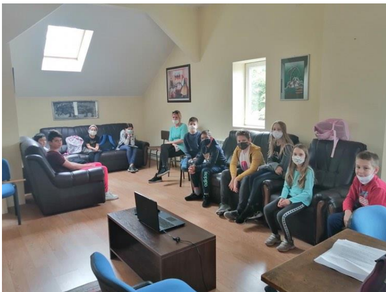
Радионица „Музика и цртани филм“ у Ст. Пазови