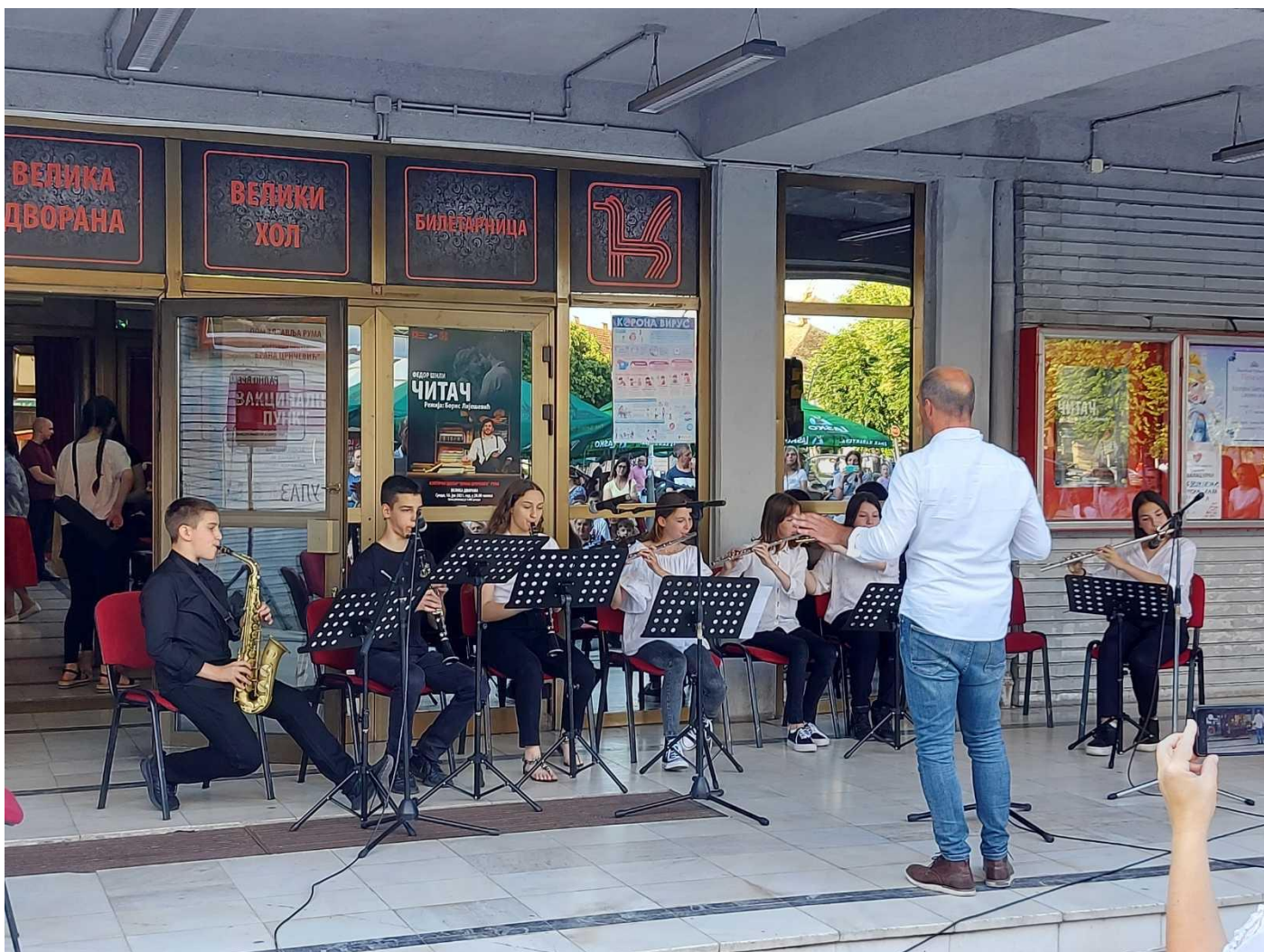
Наступ дувачког ансамбла