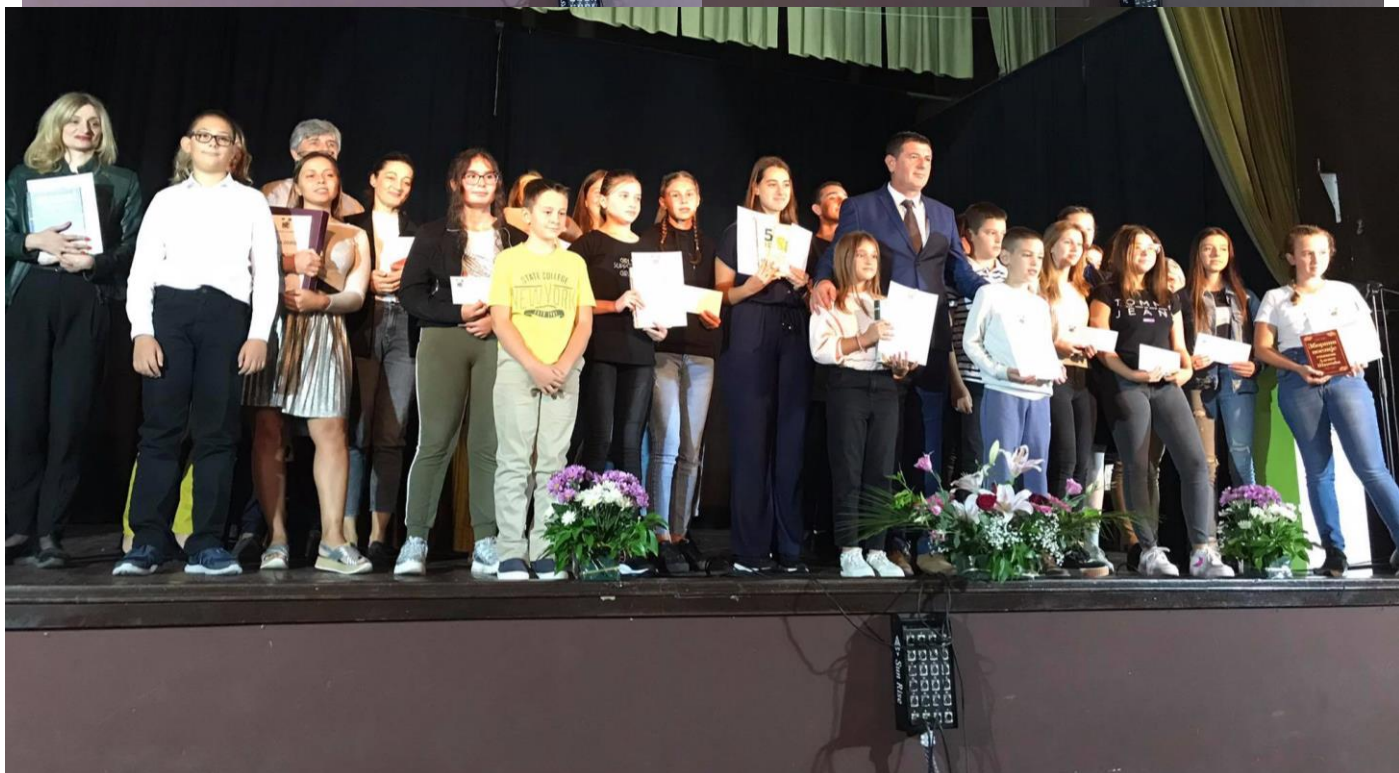
Са доделе награда најбољим ученицима у општини Пећинци